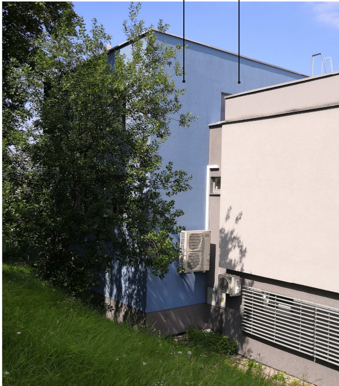
Jižní fasáda Plocha 79,5m².

Čištění a mytí stávající fasády + nový nátěr v odstínu východní fasády. Rozsah renovace - jižní fasáda této části objektu.