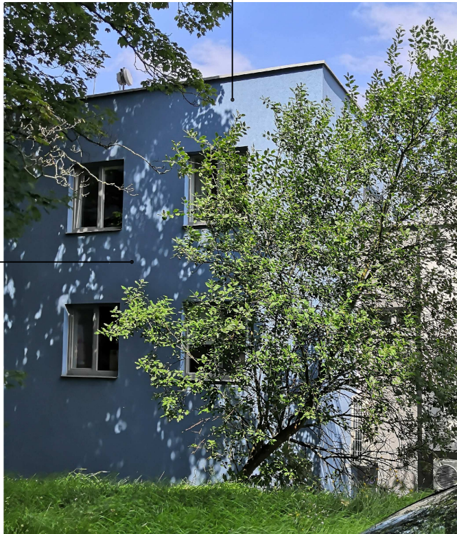
Západní fasáda Plocha 80m².

Čištění a mytí stávající fasády + nový nátěr v odstínu východní fasády. Rozsah renovace - západní fasáda této části objektu.